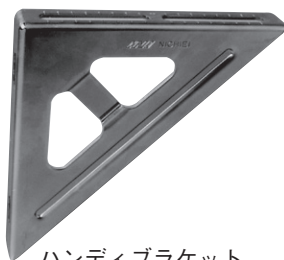
ハンディブラケット