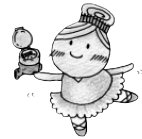
マワリーナちゃん